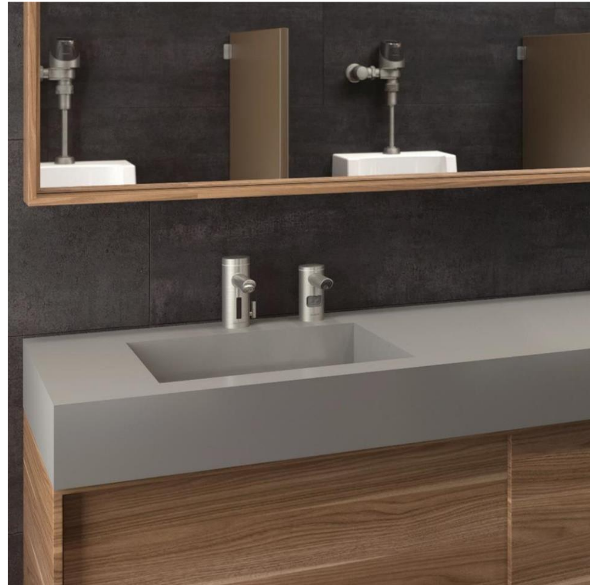
Shown: Sloan DSWD-82000 Weir Deck with Individual Basins and laminated cabinet enclosure. With EAF-275-ISM Faucet and ESD-2000 Soap Dispenser both in PVDBN Brushed Nickel Finish.