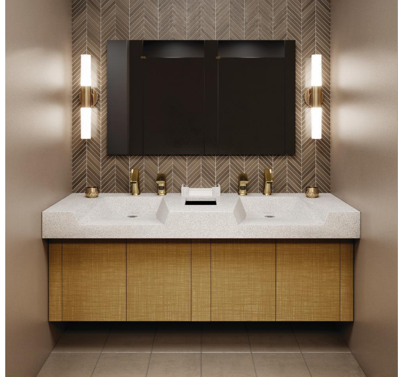
Shown: Sloan DSOF-82000 Open Front Sink with EFX-250 Faucet and ESD-500 Soap Dispenser both in PVDPB Polished Brass Finish .

https://www.gojo.com/en/Newsroom/Blog/2014/Liquid-Soap-Water-Savings-Battle