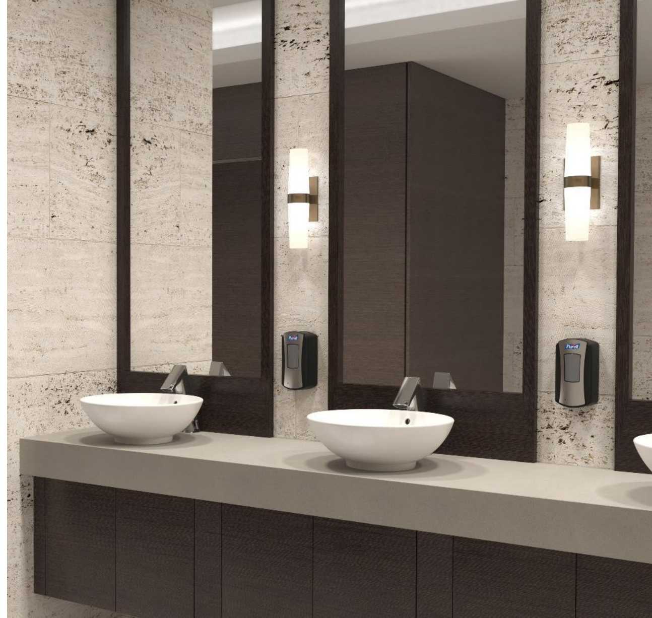
Shown: Sloan DSVR-83000 Vessel Sink with Corian Linen countertop and laminated cabinet enclosure with BASYS EFX-200 Faucet and wall mounted GOJO soap dispenser