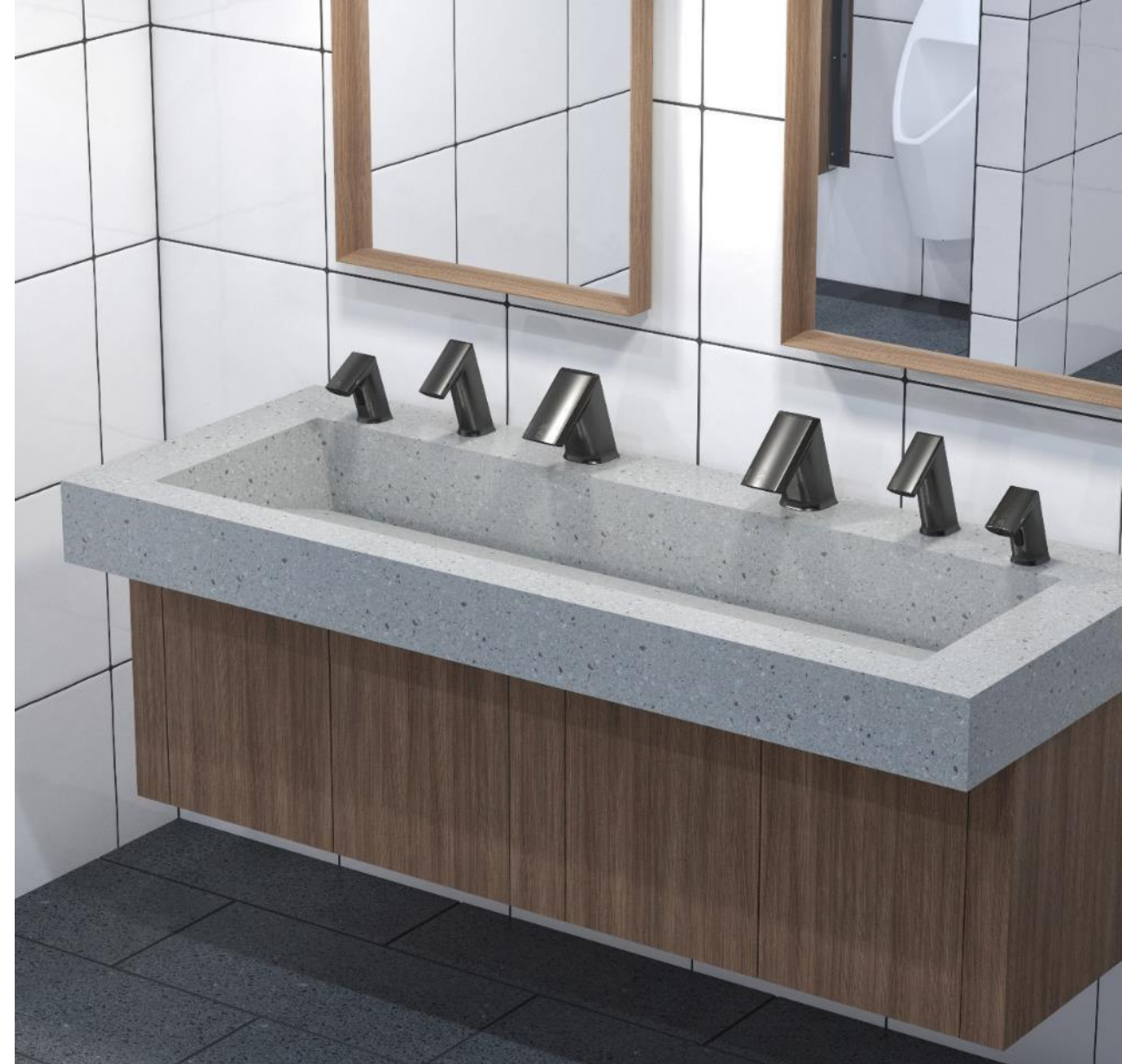
Shown: Sloan DSG-82000 Gradient sink in Corian Blue Pebble with BASYS EFX-250 Faucet, ESD-400 Soap Dispenser and BASYS Hand Dryer all in PVD Graphite . In mirror HYB-7000 Wall Hung Urinal.