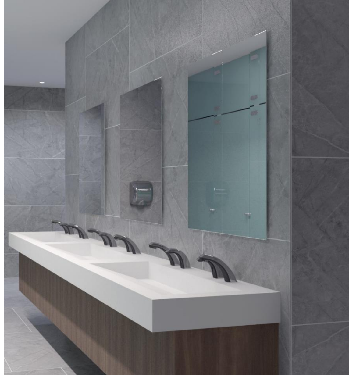
Shown: Sloan DSG-84000 sink in Corian glacier white with laminated cabinet enclosure and EBF-85 faucet and ESD-800 soap dispenser