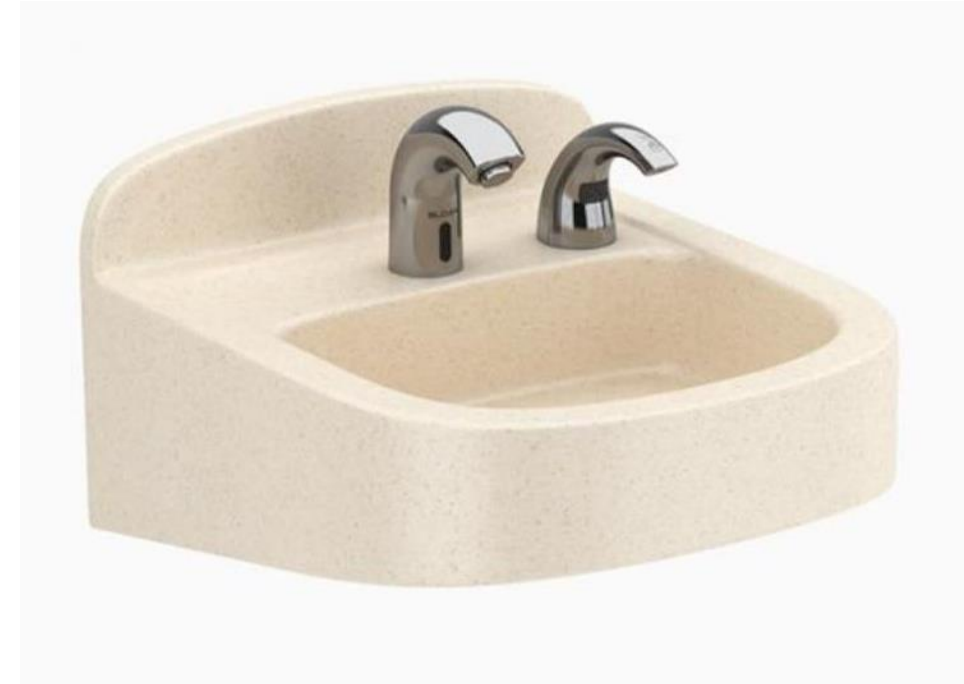
Shown: SloanStone ELS-41000 Sink in Sand (SS) with SF-2100 Faucet and ESD-2100 Soap Dispenser