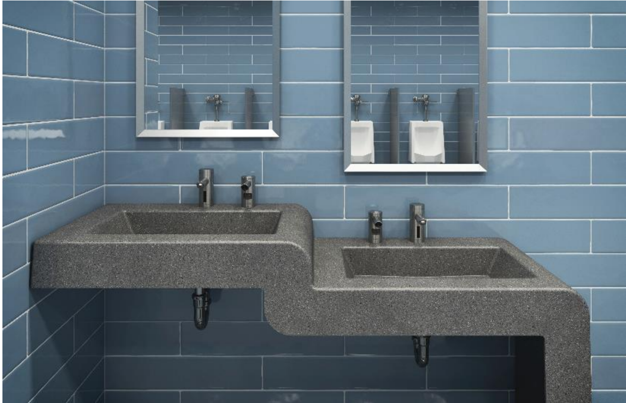
Shown: SloanStone ELWF-82000 Waterfall Sink in Matrix Light Grey with EAF-200 Faucet and ESD-2000 Soap Dispenser.