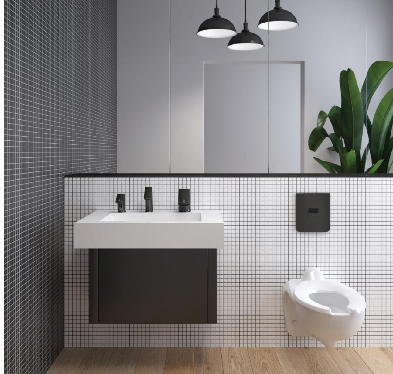
Shown: CX 8158 Sensor Flushometer with ST-2469 Water Closet, AER-DEC Integrated Sink System with BASYS EFX-250 Sensor Faucet, ESD-500 Soap Dispenser and BASYS Hand Dryer (for AER-DEC only) in PVDGR Graphite Finish .

Para opciones sobre cubierta – existen cubiertas inferiores para restringir el acceso al cartucho.