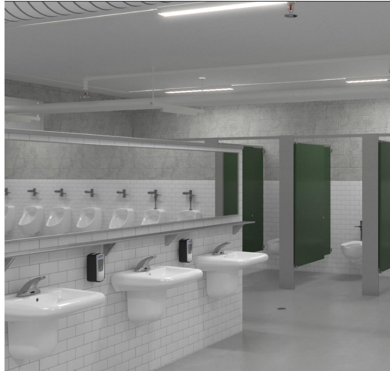
Shown: SS-3065 Wall Mounted Ledgeback Vitreous China Lavatory with SF-2300 Faucet and wall mounted GOJO soap dispenser

Para opciones sobre cubierta – existen cubiertas inferiores para restringir el acceso al cartucho.