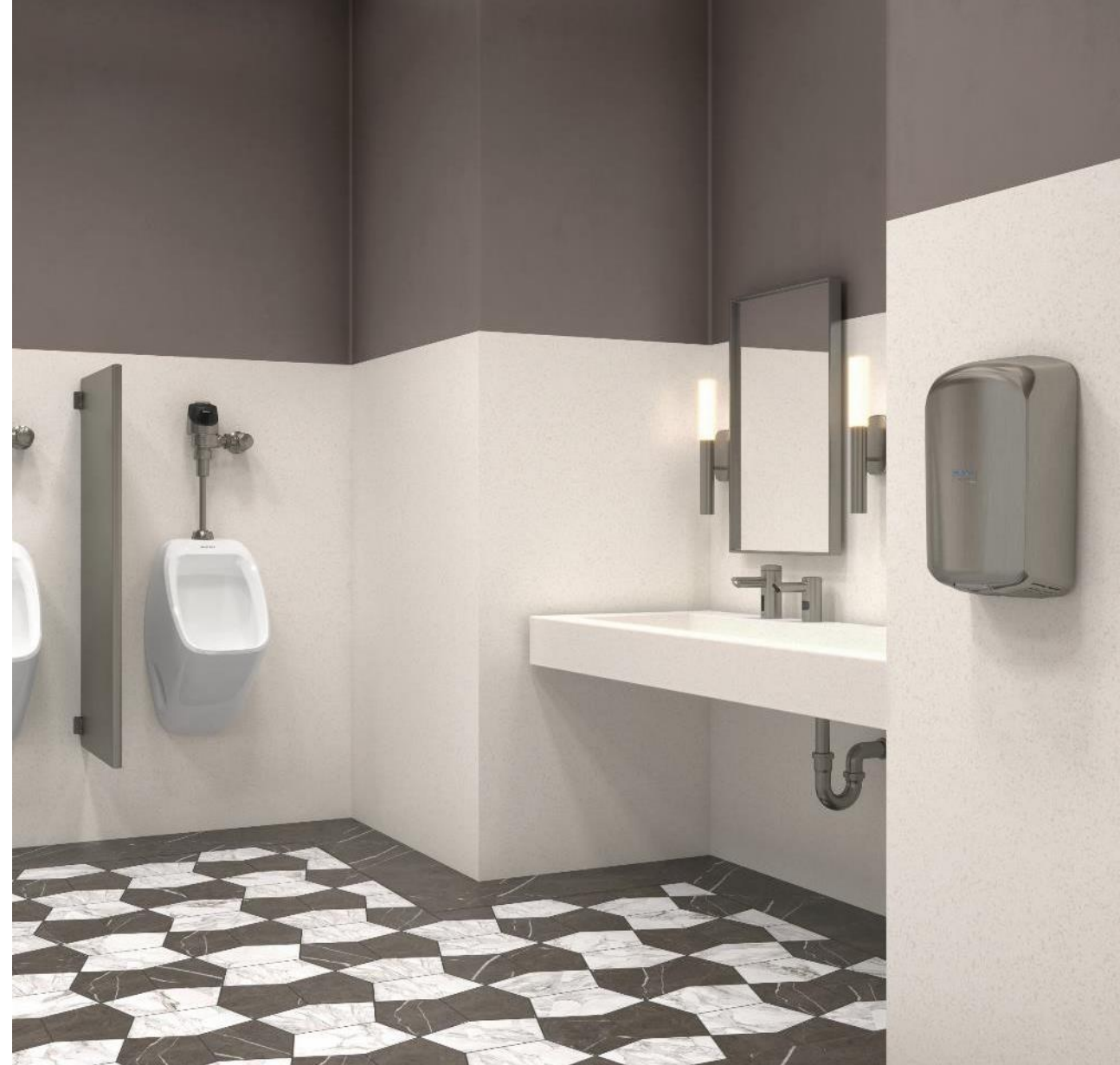
Shown: DSG-81000 Gradient Sink with EAF-250 Faucet and ESD-2000 Soap Dispenser, G2 8186 Sensor Flushometer with SU-7409 Designer Urinal, Sloan Optima Air Hand Dryer