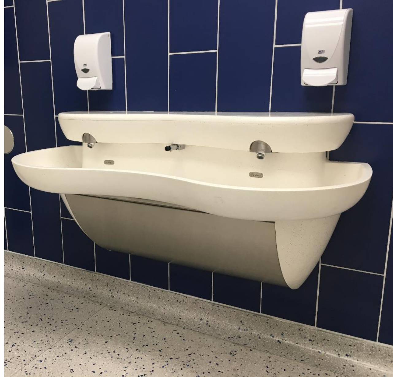
Shown: SloanStone EW-72000 Sink with Integrated Faucet and Soap Dispenser in White

Para opciones sobre cubierta – existen cubiertas inferiores para restringir el acceso al cartucho